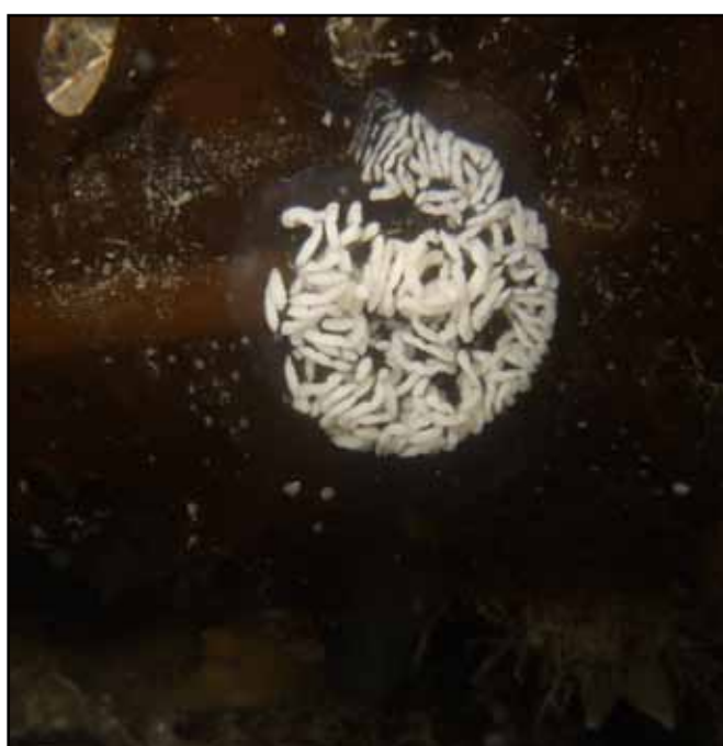
Wit tip naaktslakje

duik volgens het boekje af. Als wij naar boven waren gegaan hadden we in ieder geval een hele mooie zeedonderpad gemist (foto). Eenmaal boven water gekomen stapten wij op de boot waarna onze flessen werden gevuld voor de nachtduik. De nachtduik zou plaatsvinden bij De Muur waar we vlak voordat we te water gingen een zeehond zagen zwemmen. De clubgenoten die onder dek zaten waren redelijk snel boven op het dek op het moment dat er werd geroepen: “zeehond aan stuurboord”. Jammer genoeg was iedereen te laat met zijn camera. Ach ja, volgende keer beter. Maar bijzonder was het wel. Een zeehond zie je tenslotte niet vaak in de Grevelinge.