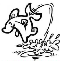
Duik met Delta Duikteam de kerst in

Zoals jullie gezien hebben staat de jaarlijkse " vlak voor kerst duik " op 18 december het programma. Ook dit jaar maakt de organisatie er weer een groot feest van. Op dit moment hebben zich al 24 mensen (!) ingeschreven, waarvan een groot aantal ook gaan duiken.... Wij nodigen jullie van harte uit om hieraan mee te doen. Als je mee wilt, geef je dan tijdig op via de site.