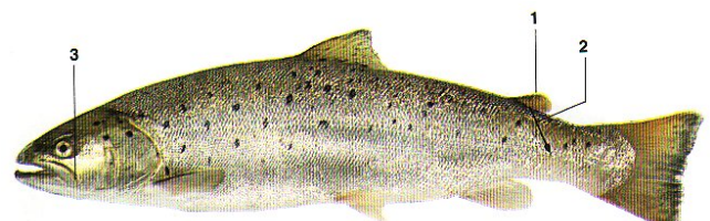
Welke vis is dit?