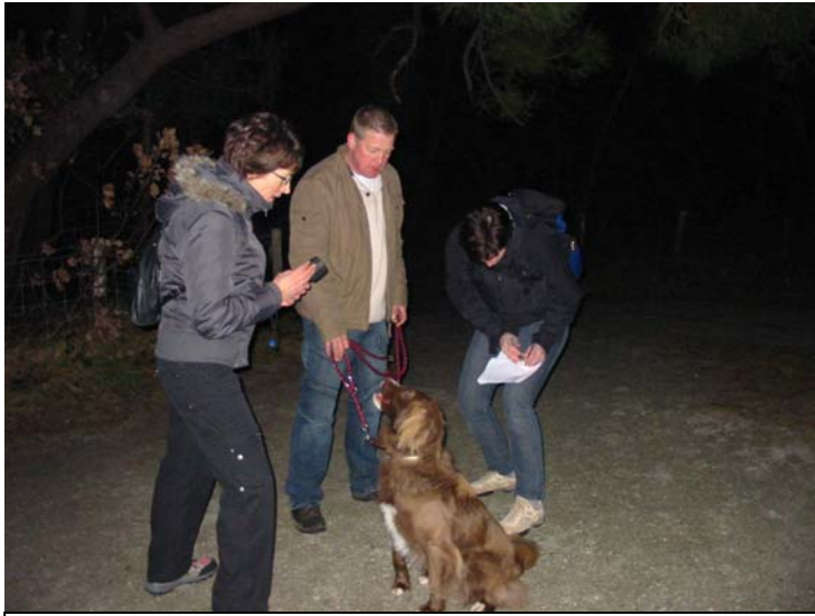
Het winnende team in actie !